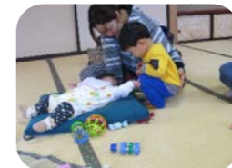
赤ちゃん可愛いな