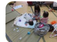
トントンしてあげるね