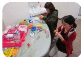
今回はパパも3人参加してくれました。 パパもママも手作りおもちゃをつくる表 情は真剣!!どんなおもちゃができるかな~