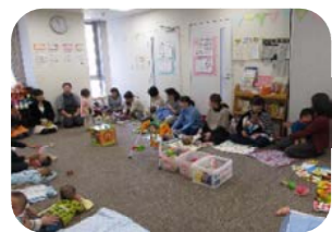
10/22(木)赤ちゃんサロン