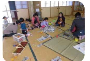
新聞紙を集めて宝探し! 何がかくれてる? 探してみよう