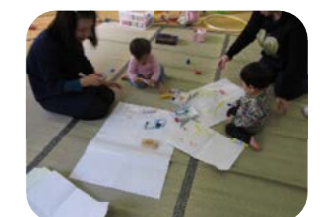
大きい紙にお絵かきも出来るよ~でもキャップの開け閉めも楽しいんだよね~