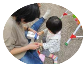
中にはママと一緒に作った子もいたよ! テープを貼ったり、お絵かきしたり... 自分で作った手作りおもちゃに大満足