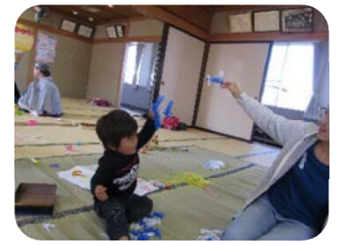
洗濯バサミが飛行機に 大変身~