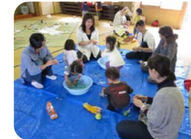
小麦粉ねんどもしたよ! ママ達もコネコネ~ 何ができるかな