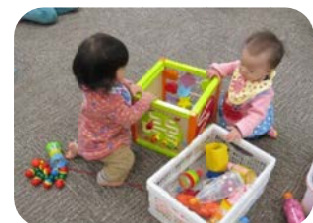
月齢ごとのサロンでは見ら れない 異年齢児の交流