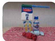
牛乳パックを利用した魚釣り、 ペットボトルマラカス、カラ カラキャンディー

11月8日(日)生涯学習フェスティバルでは遊戯室で「2才までおいでよサロン」を開催しました。 今回は「手作りおもちゃをつくってあそぼう」です。参加してくれたパパやママ達は魚釣り、ペットボトルマラカス、カラカラキャンディーの中からひとつ選びおしゃべりしながら楽しそうに作っていました。完成したおもちゃは世界にひとつだけの我が子へのプレゼントになりました。