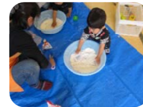
小麦粉ねんどをつくる ところから始めたよ

今年も「やってみたい」の気持ちを大切に、ママ達も息抜きできる時間を作っていきたいです。今回も小麦粉ねんどや新聞紙などの身近な素材を使ってたくさん遊び、ママ達も「押し花でしおりづくり」や「あみあみ教室」をしました。その様子をお知らせします。