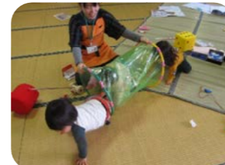
フープとポリ袋でトンネルが できたよ!くぐってみて~