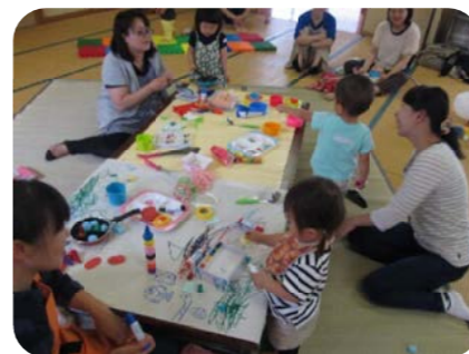
大きなテーブルにおもいっきりお絵かきしたり、初めてのシールをはったり ママ達も自然と集まりおしゃべりタイム

水あそびやししゃぼん玉あそびなど外での活動を楽しんだ移動子育てサロン「おひさま」の様子をお知らせします。