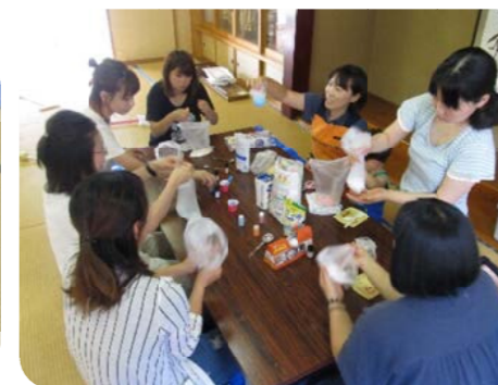
子ども達はいつの間にか自分の好きな場所であそんでいます。 ~ママ達はみんなで集まってバスボムづくり~ その後、ママ達のつくったバスボムを入れて水あそびをしました