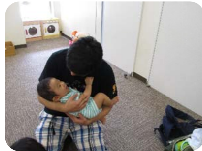
我が子より小さい赤ちゃんを抱っこ 「かるいなあ～」