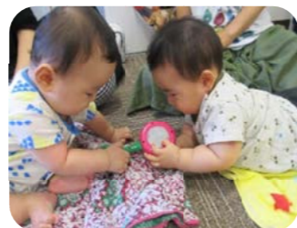
どんなに小さくても自分のやりたいことあるんだね!