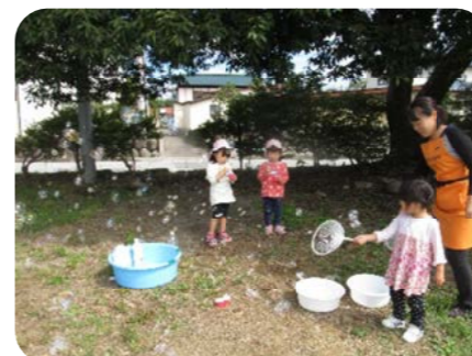
うちわの骨を使ってのしゃぼん玉もしたよ~ たくさんのしゃぼん玉が飛んでいったね