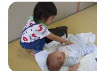
0~3才までの移動子育てサロンなので異年齢児のかかわりがたくさんみられます!小さなママがたくさんいるので兄弟が一緒に参加でも大丈夫です!