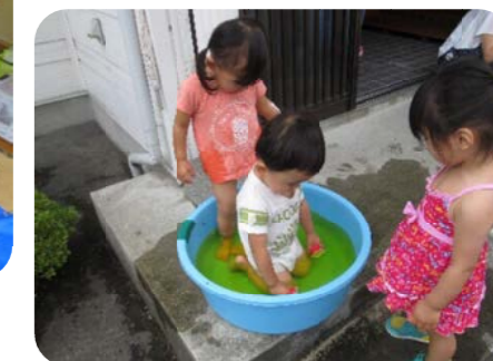
服を着たままジャパーン!!