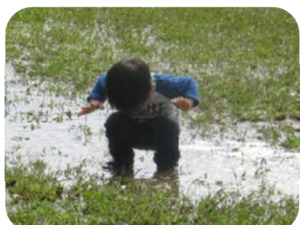
ぼくは水たまりに入るのが大好き!