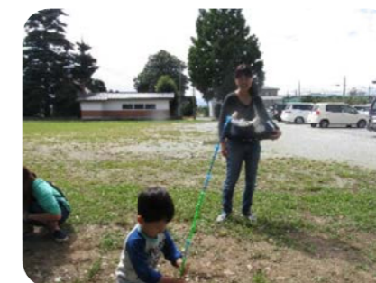
しゃぼん玉のストローも使い方次第で こんな遊びになるのです...(^^)