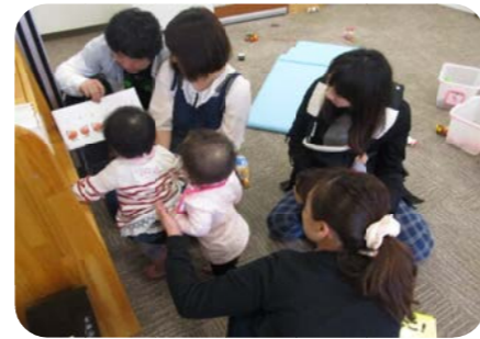
パパの読み聞かせが始まると 自然とみんなが集まります

毎月第2第4土曜日に開催している土曜日サロン。「いつもママと赤ちゃんが来ている場所ってどんどころ?」「気になる場所だけ入りづらいなあ」と思っているパパ達が参加しやすいサロンです。(お母さんだけやお祖母ちゃんと一緒でも、大丈夫です。) パパ達も顔見知りになるとパパ同士やママも一緒に話が弾みます。お風呂で子どもと楽しむ方法やママへの気配り(?)方法を熱く語ったり、ぐずり始めた我が子を懸命にあやしたり、隣にいた赤ちゃんを抱き上げ遊んでくれたり、パパの意外な一面が見えるかも...。 身長体重測定やふれあい遊び・絵本の読み聞かせも行っています。パパを誘って遊びに来て下さい。